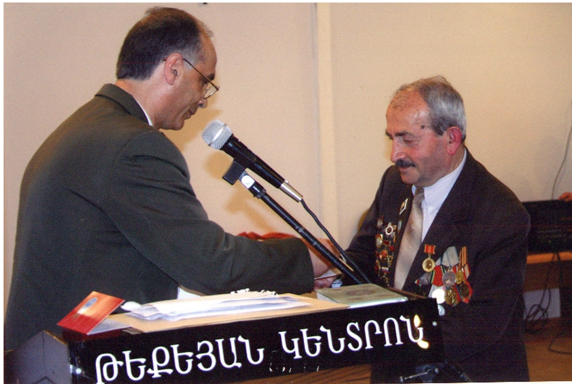
Во время присвоения звания «Заслуженный энергетик СНГ»

За военные заслуги отец был награжден орденами и медалями во время и после окончания Великой Отечественной войны - Орденом «Красной звезды», Орденами Великой Отечественной войны 1-ой и 2-ой степени, двумя медалями «За отвагу», «За оборону Кавказа», «За победу над Германией в Великой Отечественной войне», «За доблестный труд в Великой Отечественной войне», медалями «10 лет победы в Великой Отечественной войне», «20 лет победы в Великой Отечественной войне», «30 лет победы в Великой Отечественной войне», «40 лет победы в Великой Отечественной войне», «50 лет победы в Великой Отечественной войне», «60 лет победы в Великой Отечественной войне», «70 лет Вооруженных Сил СССР», «Ветеран труда».