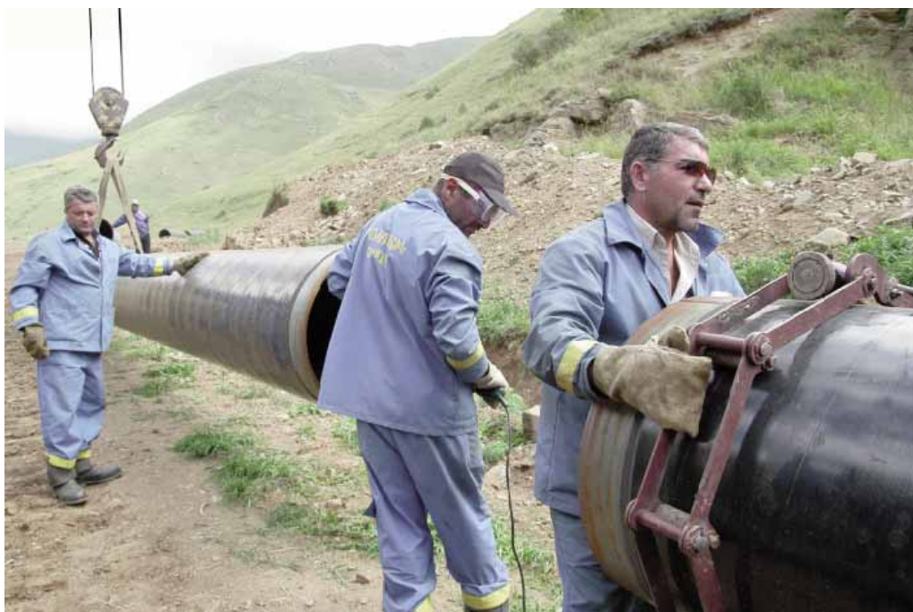
Строительство газопровода «Иран — Армения»

Реализация масштабных проектов компанией «Газпром Армения» стала возможной благодаря доверию, пониманию и всестороннему содействию со стороны руководства ОАО «Газпром».