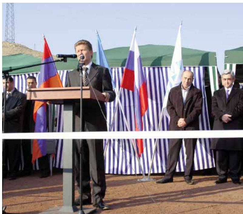
Торжественная церемония завершения строительства магистрального газопровода «Иран — Армения».

Ремонтно-восстановительные работы на объектах ГТС производятся силами Специализированного филиала подземных