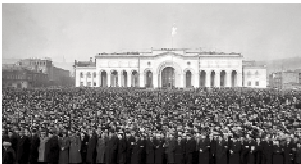
На снимках: строительство газопровода «Казах — Ереван» (слева); церемония зажжения газового факела в Ереване 12 февраля 1960 года