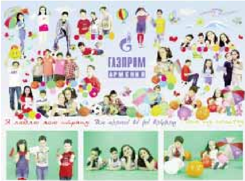
Патриотическая акция — флешмоб «Я люблю мою страну»

ЗАО «Газпром Армения» есть команда по футболу, которая довольно успешно выступает на матчах, организуемых между сборными различных компаний и организаций. Футбольная команда ЗАО «Газпром Армения» основана в 2007 году и является одним из лидеров любительского футбола в Армении.