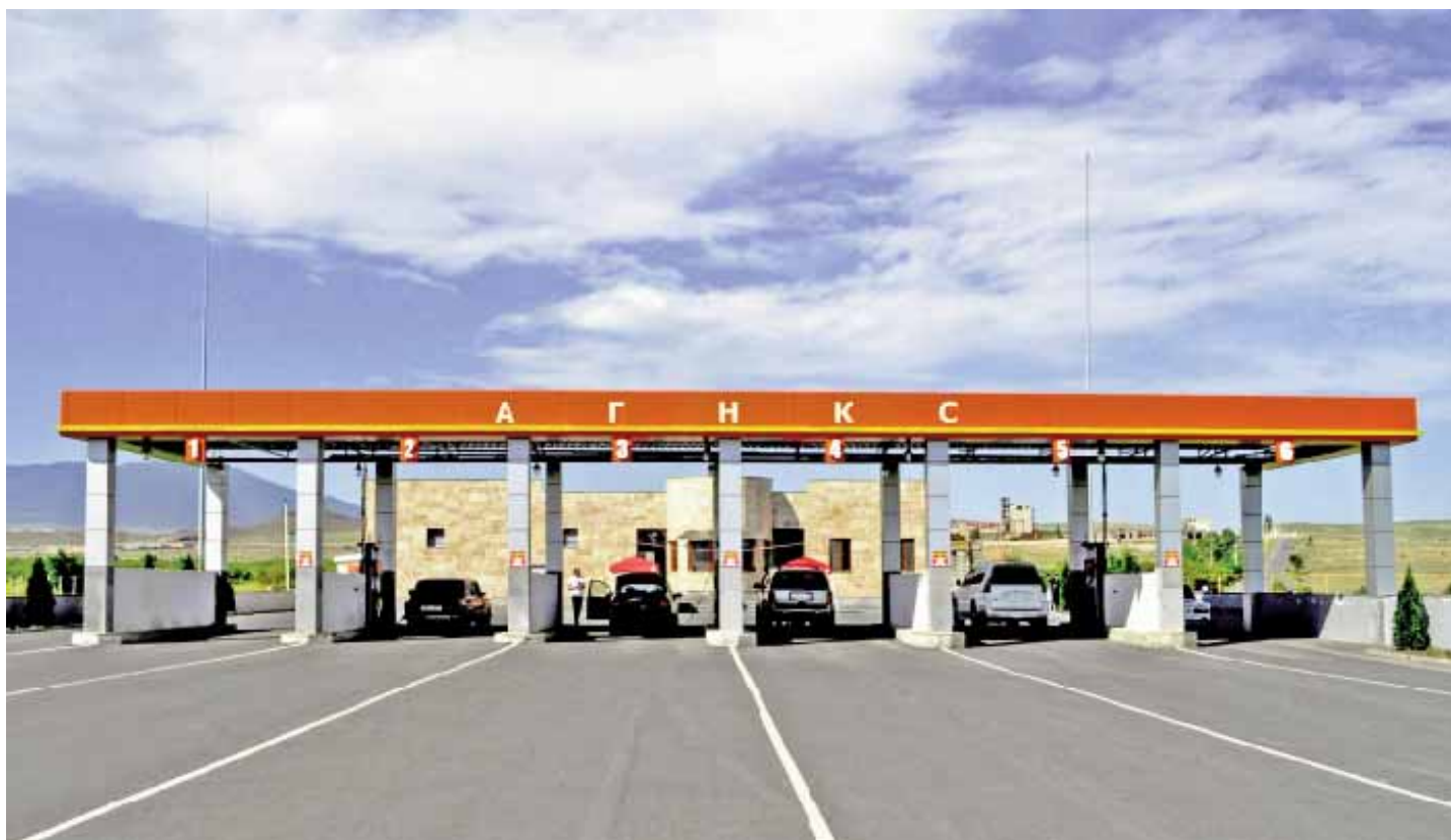
Автомобили заправляются компримированным природным газом

тают бензину газ, экономя значительные средства.