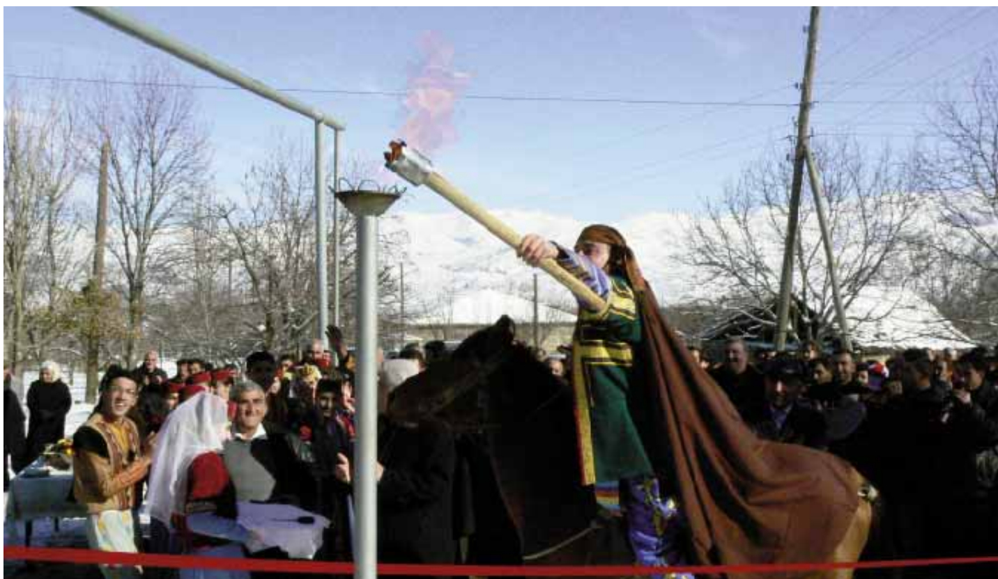
Природный газ поступил в Вайоцдзорскую область Армении