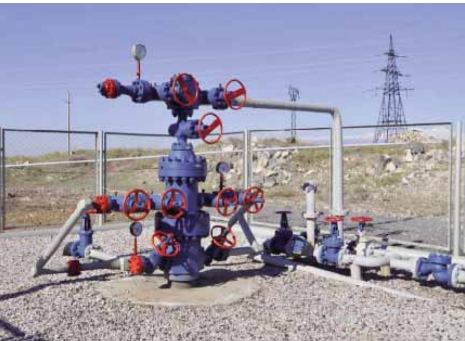
Абовянская станция подземного хранения газа

работ (СФПР), также входящего в состав ООО «Трансгаз». Ими же, при технологическом сопровождении (геофизические и проектные работы) со стороны ООО «Газпром геотехнологии», осуществляются ремонтно-восстановительные работы по подземному комплексу СПХГ.